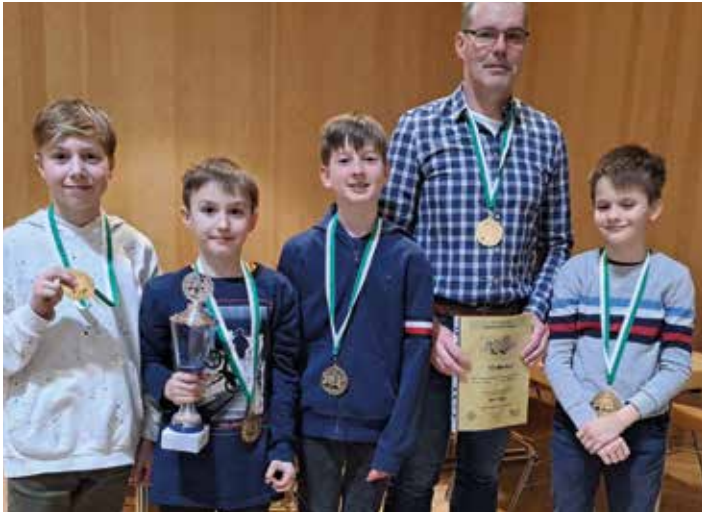
Die erfolgreiche Schachmannschaft der VS-Bärnbach

Bei der 27. Jugendschacholympiade in Gratwein-Straßengel gewann die Mannschaft der Volksschule Bärnbach ungeschlagen den Bewerb der Volksschulen und qualifizierte sich für das Bundesfinale im Mai in Graz.