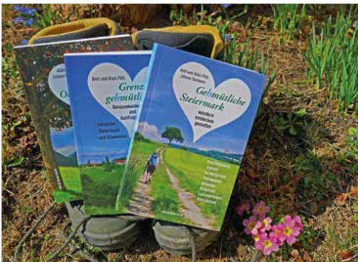
Wanderführer mit 40 steirischen Genusswanderungen

Neuer Wanderführer: Durch das Herz der „Grünen Mark“