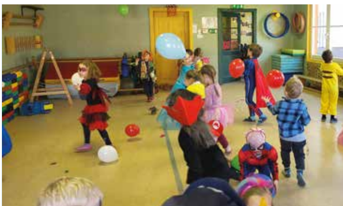
Das Turnsaalfenster war kurzfristig der Eingang

So ein Quatschtag, der ist lustig, so ein Quatschtag, der ist schön.