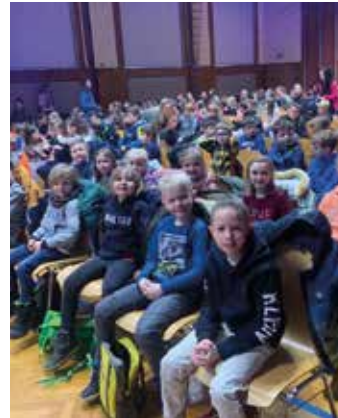
Musicalbesuch in Edelschrott

Am 13. Februar besuchte die VS Afling die Musicalvorstellung „Die Abenteuer des Tom Sawyer“. Gespannt und mit viel Bewunderung wurde den Dar-