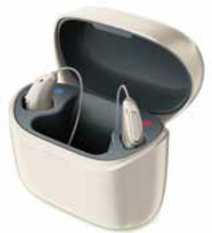
Neu bei Hansaton: Audéo Lumity Hörsystem (Medizinprodukt)

ne. Nach einem professionellen Hörtest, können Sie neueste Hörgeräte kostenlos Probe tragen. Infos und Termine unter 0800 880 888 (Anruf kostenlos), auf hansaton.at oder direkt bei Hansaton!