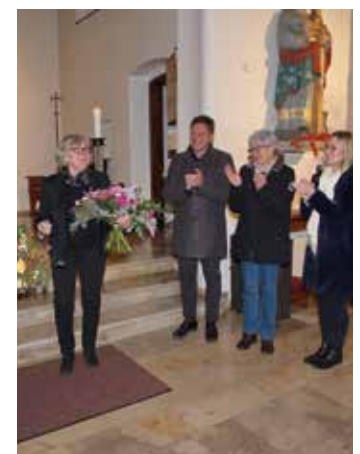
Blumenstrauß als Dankeschön

Die Stadtgemeinde Bärnbach bedankt sich für die zahlreichen