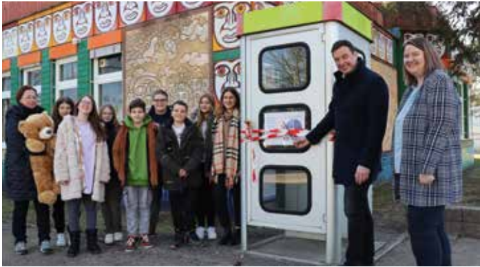
Eine alte Telefonzelle wird zur Bildungsstätte

Aus einer Telefonzelle wird ein Bücherschrank