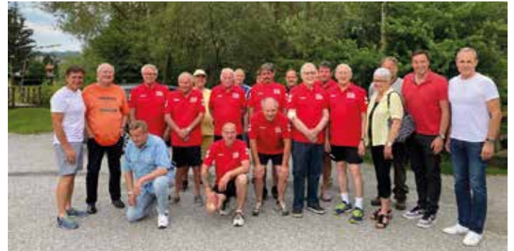
Stellvertretend für hunderte Anlässe: Eine Dressenübergabe,...

13 Jahre, in denen ich mich gerne und mit ganzem Herzen der Gemeindepolitik widmete, haben