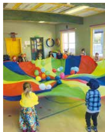
Die Wirkung von Farben

Bärnbach! Ein farbenfroher und absolut einzigartiger Tag, der allen Kindern in Erinnerung bleiben wird. Die Kinder durften sich schon im Vorfeld Dinge überlegen, die nur am Faschingsdienstag umgesetzt werden dürfen.