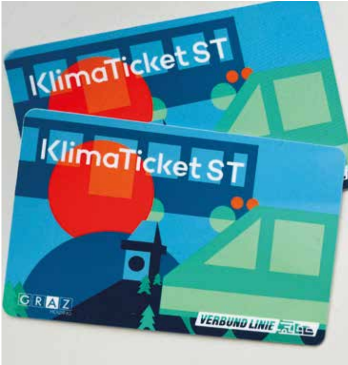
Telefonische Vorreservierung ist notwendig

BärnbacherInnen können steiermarkweit kostenlos fahren