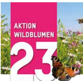
Ziel: Ein positives Ökosystem

Bärnbach ist Partner der Aktion Wildblumen