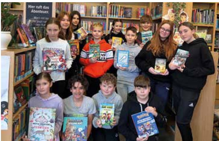
SchülerInnen der MS Bärnbach freuen sich über neue Bücher

Danke an den Gemeinderat der Stadt Bärnbach, der Geld für die Bibliothek sponserte.