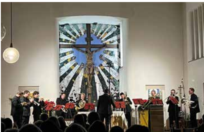
Begnadete MusikerInnen in der Bärnbacher Kirche

Ein musikalisches Highlight in der Kirche der Heiligen Barbara in Bärnbach.