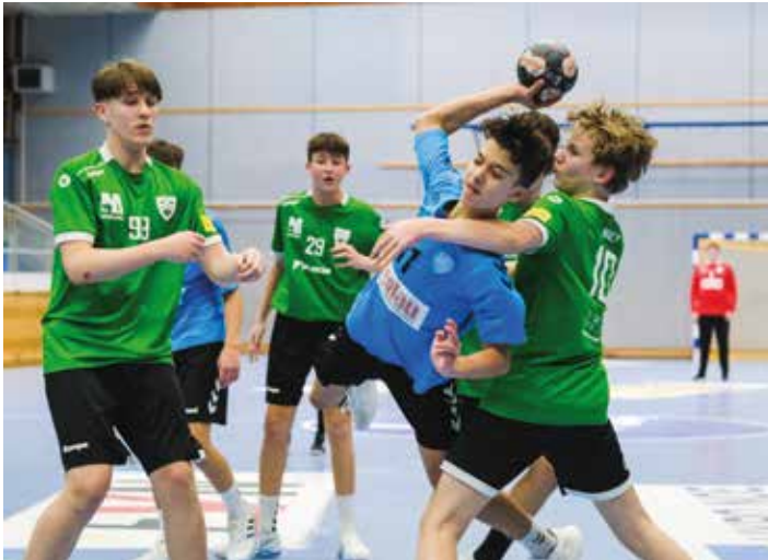
Die Jugendmannschaften der HSG zeigten in allen Bewerben ihre Stärke

Neuigkeiten aus dem Handballrevier Weststeiermark