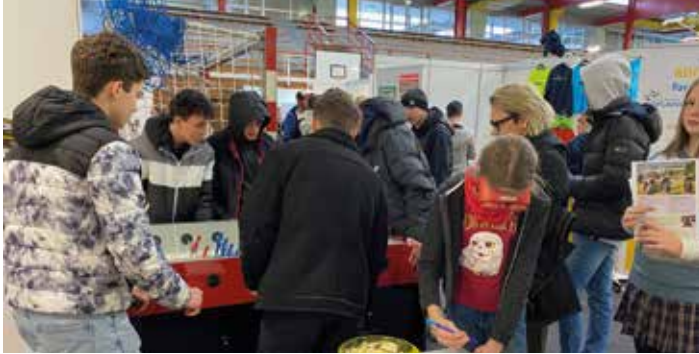
Infos über Jugendzentrum auf der Berufsmesse

Berufsinformationsmesse, Gesprächsrunde und Magie Club