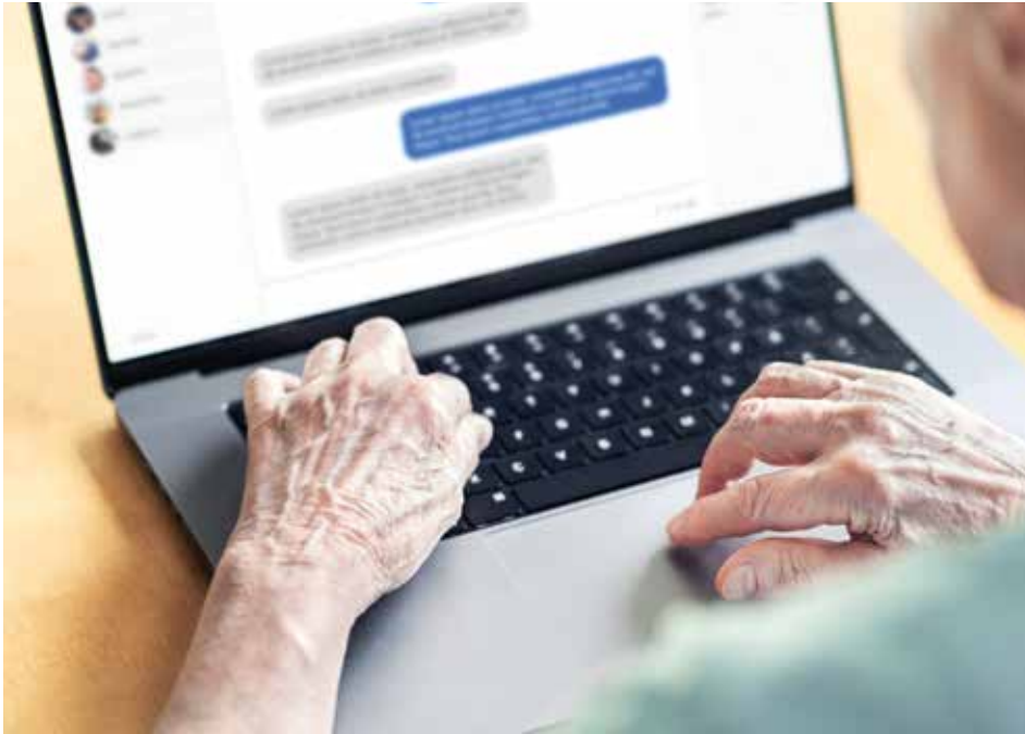
Ältere Menschen fallen oft auf InternetbetrügerInnen herein

Auf Facebook: Ältere und einsame Menschen werden besonders oft Opfer