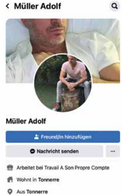
Achtung vor unseriösen Facebookprofilen

Schützen Sie im Internet Ihre eigene Identität. Sämtliche von Ihnen bekannt gegebene persönliche Daten, erleichtern dem Täter sein Vorhaben. Vermeiden Sie es unbedingt, persönliche Fotos oder Videoaufnahmen mit dem Täter auszutauschen. Dies erleichtert dem Täter die spätere Umsetzung der Tat, indem er Sie möglicherweise mit der Veröffentlichung derartiger Bilder unter Druck setzt. Einem ersten persönlichen Treffen sollten immer Telefonate vorausgehen. Erste Treffen sollten immer an öffentlichen und/oder gut besuchten Orten stattfinden. Scheuen Sie sich nicht eine Anzeige zu erstatten; wir alle wissen: „Liebe macht blind“! Das ist auch der Grund, warum Täter die Gefühls-