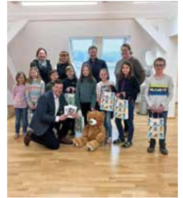
BÄRnhard wurde vorgestellt

Wir möchten uns bei allen bedanken, die sich eifrig an der Namenssuche beteiligt haben. Aus den Einreichungen hat sich der Name BÄRnhard ergeben. Kinder, die diesen Namen auf ihre Zeichnungen geschrieben haben, haben eine kleine Belohnung erhalten. Bgm. Bocksrucker überreichte Gutscheine fürs Schlossbad Bärnbach und von der Buchhandlung Lesezeichen.