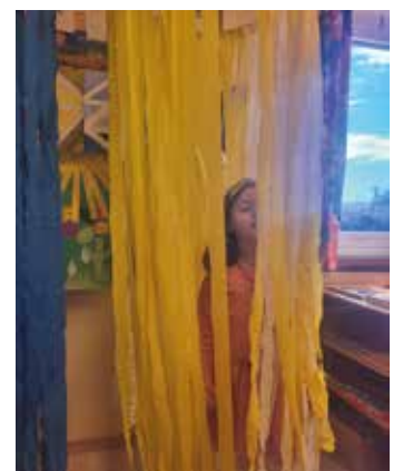
Im Kindergarten mit Pyjama

Da gab es z.B: den Eingang durch das Turnsaalfenster, Nutella zum Frühstück, Besuch des Kindergartens im Pyjama, Almdudler in der Trinkbar und Kinderkino mit Popcorn. Das Thema „Farben und ihre Wirkung auf