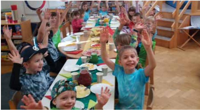
In der Pause gab es gefärbte Muffins und bunte Fruchtsäfte

Farbenzauber im Kinderhaus Die Faschingszeit im Kinderhaus war kunterbunt. Neben dem traditionellen Faschingsdienstag gab es davor im Kinderhaus ein