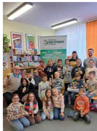
Die 4b-Klasse in der Bibliothek

Kürzlich besuchte die 4b Klasse der VS Bärnbach die Stadtbibliothek Bärnbach.