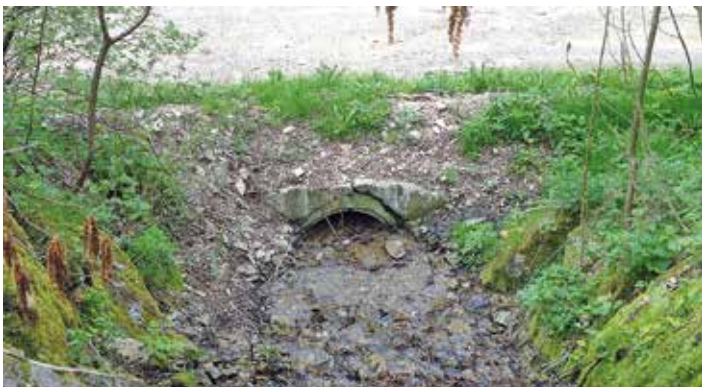
Bachbett und Uferbereich werden kontrolliert

Schutz und Sicherheit der Bevölkerung und ihrer Besitztümer