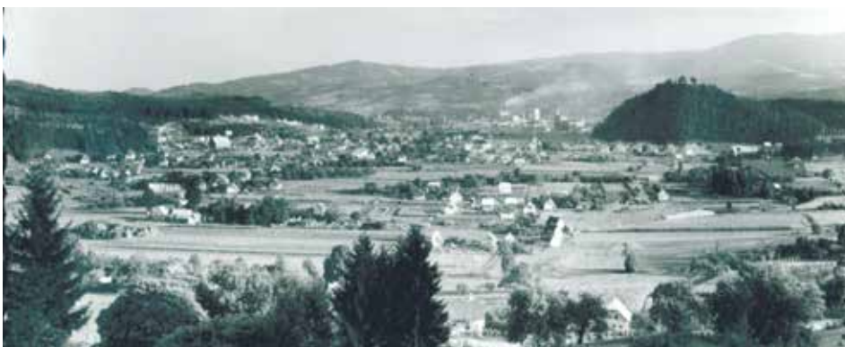
Postkartenverlag Walter Kramer, Graz-Eggenberg

Blick vom Knobelberg in Richtung Heiliger Berg