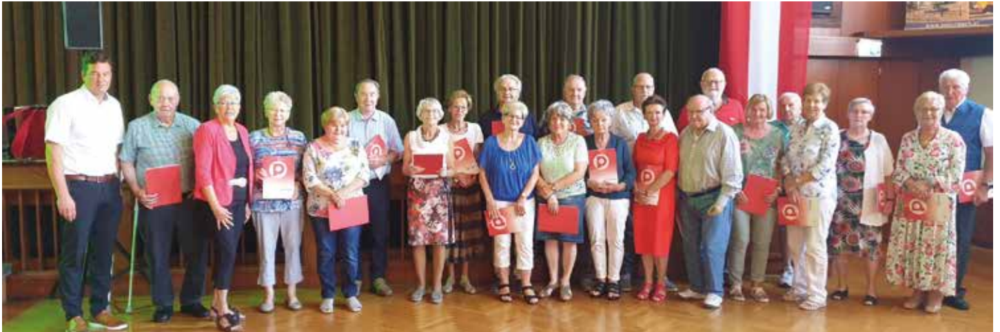
Einer der Höhepunkte aus der Vergangenheit: Ehrung langjähriger Mitglieder im Sommer 2022 im Volkshaus Bärnbach

Endlich ist Corona vorbei und es gibt wieder zahlreiche Veranstaltungen