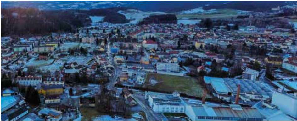
Zahlreiche Lauf- und Wanderwege führen rund um Bärnbach

Sport, Ernährung und Fitness für alle Generationen