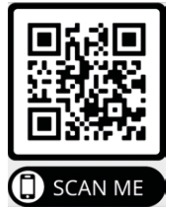
QR-Code zum Video

Voller Hingabe drehten die Kinder ein tolles Video für die Bewerbung. In diesem Video begeisterten die SchülerInnen mit einem Rollenspiel und Fangesängen. Die Kinder würden sich