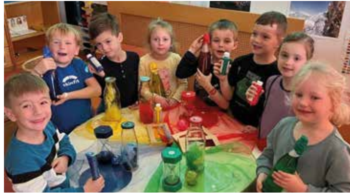
Spaß beim Forschen und Experimentieren

Große Freude bereiten den Kindern des Städtischen Kindergartens Bärnbach die neuen Anybook-Reader, die im Rahmen der digitalen Medienbildung in elementaren Bildungseinrichtungen erworben wurden. Sie wurden bereits in vielen Bereichen wie Sprache und Kommunika-