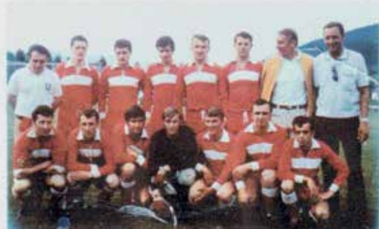
ATUS Bärnbach 1970

Privat und in Kollegenkreisen war er äußerst beliebt und half vielen Fußballerfreunden bei Veranstaltungen und Hausbau. Mit seiner Familie trauern auch viele ehemalige Mitspieler und Arbeitskollegen der Glasfabrik Bärnbach