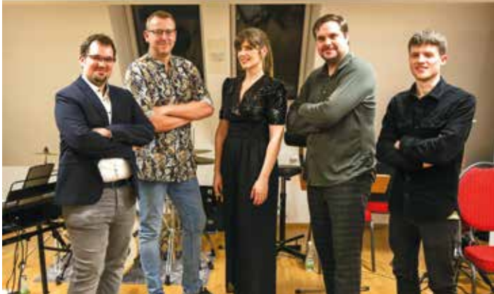
Auftritt im Dachbodentheater begeisterte die BesucherInnen

Kürzlich fand ein Konzert der Besetzung „Stella“ im Dachbodentheater der VS statt.