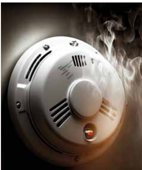
CO-Melder werden empfohlen

Kohlenmonoxidvergiftungen erfolgen meist unbemerkt. Bei unvollständigen Verbrennungsprozessen wird dieses völlig unscheinbare, jedoch umso gefährlichere Gas freigesetzt. Da es farb-, geruch- und geschmacklos ist, entzieht es sich allen menschlichen Sinnesorganen.