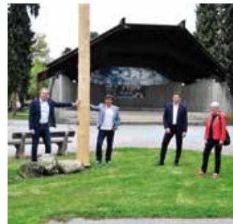
...eine Maifeier im Stadtpark,