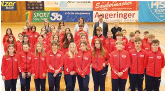
Stadtgemeinde Bärnbach unterstützte bei der Finanzierung

Die Mittelschule Bärnbach freut sich über neue ebenso moderne wie funktionelle Trainingsanzüge, die mit