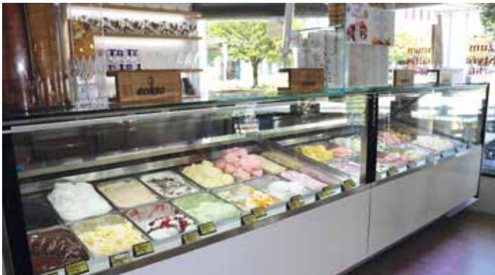
Der Familienbetrieb begeistert die Gäste mit 28 Eissorten

Im Sommer ist dieser beliebte Eissalon nicht mehr wegzudenken. Mit 28 Eissorten bietet der Familienbetrieb eine beeindruckende Auswahl für jeden Geschmack.