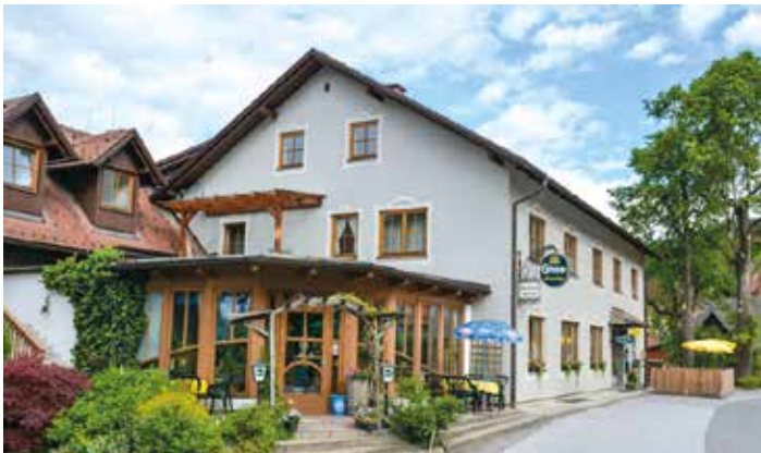
Im großen, gemütlichen Saal ist Platz für bis zu 60 Personen

Seit 1965, mittlerweile in der dritten Generation familiengeführt, hat sich das Gasthaus Müller als beliebter Gastronomiebetrieb etabliert.