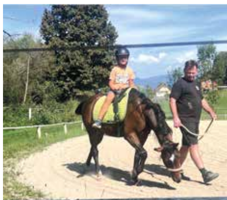
REITCLUB ORTNER KAINACH Erste Reitversuche am Reitplatz