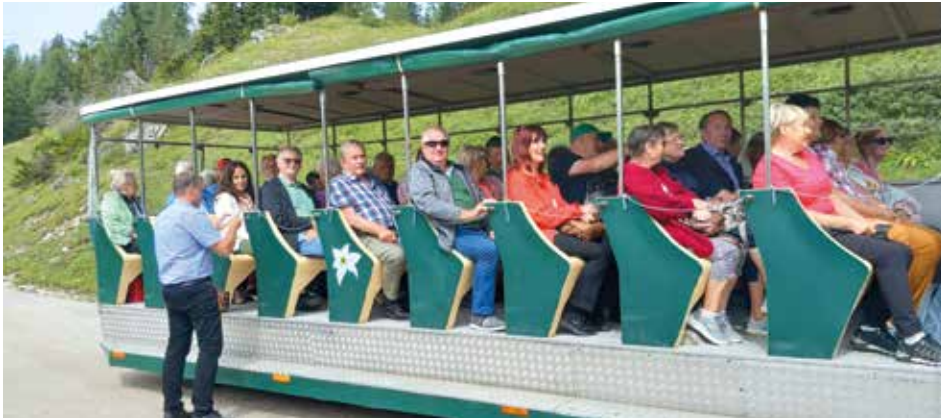
Unterhaltsame Fahrt mit dem Bummelzug auf der Tauplitzalm

Fahrt nach Slowenien, Ausflug auf die Tauplitzalm und eine Wanderung