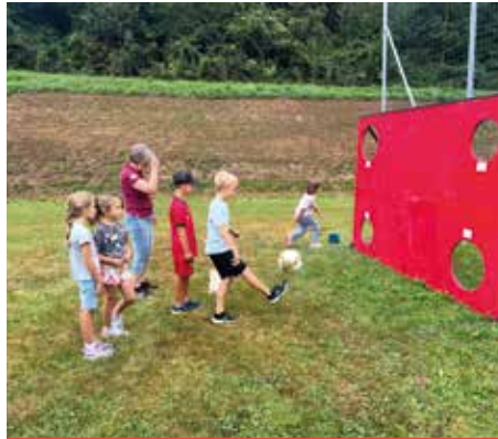
SPIELTAG IN PIBEREGG Fußballtraining an der Torwand