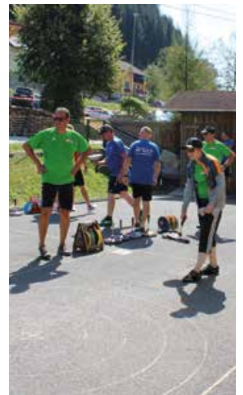
Der ESV Afling organisierte ein spannendes Asphalt-Stockturnier

Das 20. Aflinger Dorffest war ein voller Erfolg und hat einmal mehr gezeigt, wie wichtig Gemeinschaft und Tradition für unsere Stadt sind. Wir freuen uns schon jetzt auf das nächste Fest.