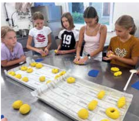
KONDITOREI ZUCKERMÜHLE Gemeinsames Backen