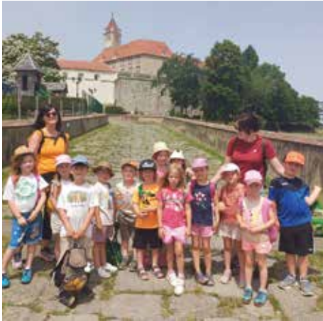
Die Riegersburg begeisterte alle

Ausflug auf die Riegersburg und Besuch der Greifvogelschau