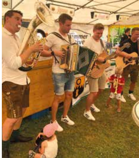
Die Weingartsberger spielten auf