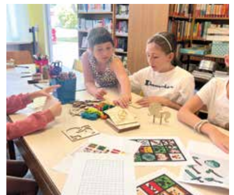
STADTBIBLIOTHEK BÄRNBACH Basteln von Holzfiguren