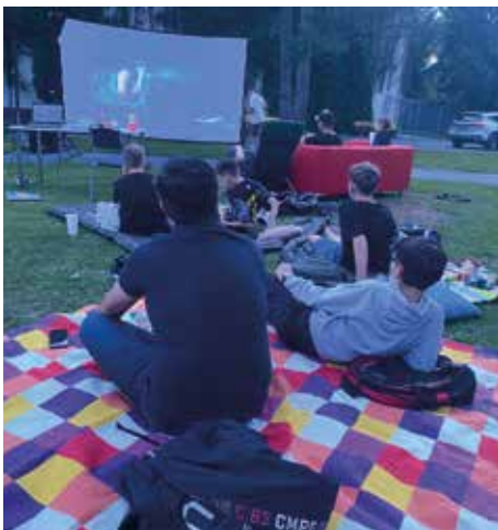
Outdoor-Kinoabend im Stadtpark