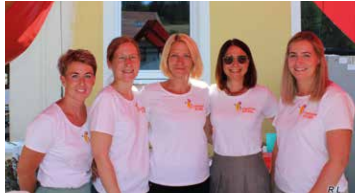
Der Elternverein der VS-Afling war einheitlich adjustiert