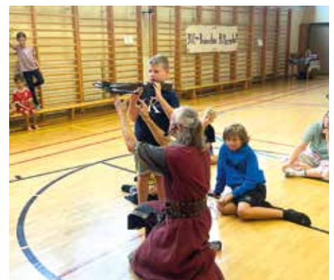
ALT-KAINACHER RITTERSCHAFT Praktischer Unterricht übers Mittelalter