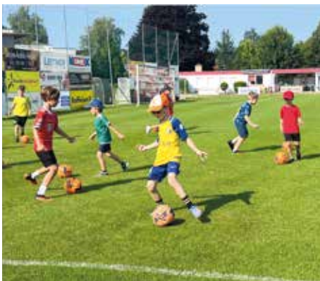
ATUS BÄRNBACH Fußballtraining im Stadion