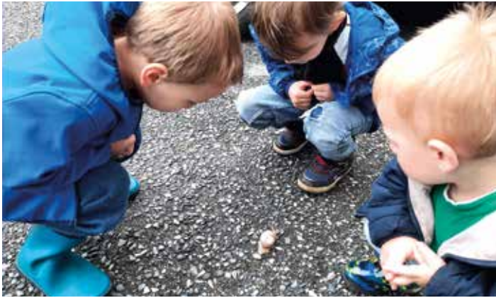
Schnecken im Garten beobachten und dabei lernen

Was es bedeutet Kinder als Tagesmutter zu betreuen