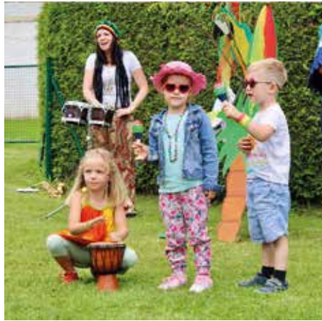
Die Reggaeegruppe auf dem Sommerfest

Es gab eine sehr spannende Führung auf der Burg, bei der es viel zu entdecken gab. Interessante Infos gab es über Ritter, Hexen, besonderen Räumen und vieles mehr.