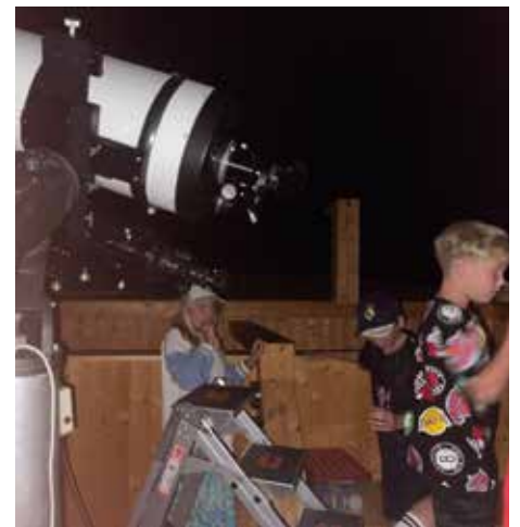
Einführung in die Astronomie

Erstmals veranstalteten wir auch einen Graffiti Kurs für Jugendliche. Graffiti ist eine Form der Kunst, die Jugendlichen erlaubt, ihre Fantasie und Kreativität auf einzigartige Weise auszudrücken. Sie können mit Farben, Formen und Stilen experimentieren und ihre künstlerische Stimme entwickeln. Jugendliche lernen, gemeinsam zu planen, Ideen auszutauschen und als Team zusammenzuarbeiten. Neben den Basistechniken der Graffiti-Kunst wurden den Jugendlichen von zwei ausgebildeten Graffiti-Artists der Respekt vor Regeln vermittelt und dass es legale und illegale Wege gibt, diese Kunst auszuüben.