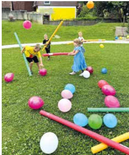
Beim Austoben im Garten

Zum Abschluss des Kindergartenjahres wurde für die zukünftigen Schulkinder eine abendliche Grillparty organisiert, bei der die Kinder viel Freude hatten.