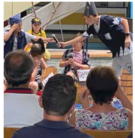
Kreativ-Camp auf Englisch

Wie jedes Jahr organisierte das JUKO Bärnbach zusätzlich zu den regulären Öffnungszeiten (Donnerstag bis Samstag jeweils ab 14.30 Uhr) ein Sommerferienprogramm für die Bärnbacher Jugendlichen. In diesem Jahr nahmen über 150 Kinder und Jugendliche an den insgesamt 7 Angeboten, die sich teilweise auch über mehrere Tage erstreckten, teil.