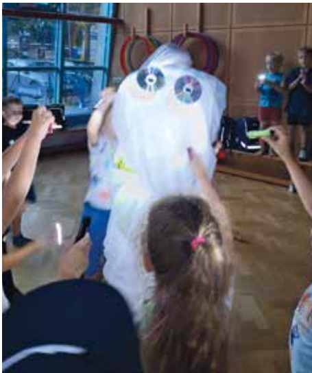
Lustige Geisterstunde mit den Kindern

Abendliche Grillparty, spannende Spiele und Eis vom Corso