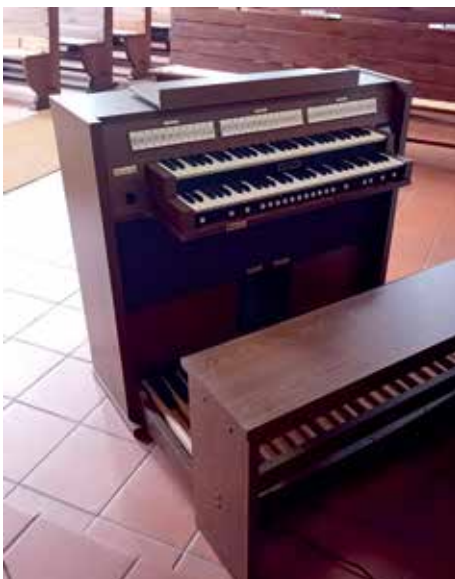
Die neue Orgel wartet auf ihren Einsatz

Neue Orgel wird am Reformationstag erklingen