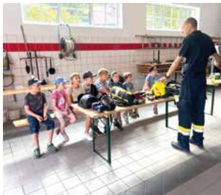
STADTFEUERWEHR BÄRNBACH Infos über Feuerwehrausrüstung