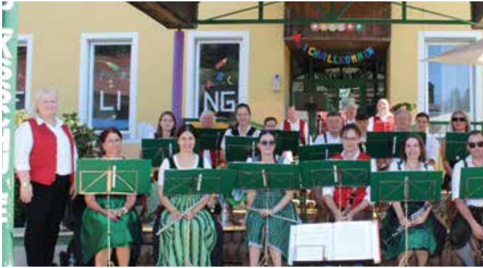
Der Musikverein Kainachtal umrahmte das Fest gemeinsam mit anderen Gruppen und sorgte so für ausgezeichnete Stimmung

Ein gelungenes Wiedersehen nach einer langen Pause