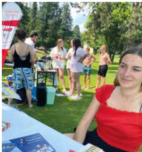
Nachmittag im Schlossbad Bärnbach