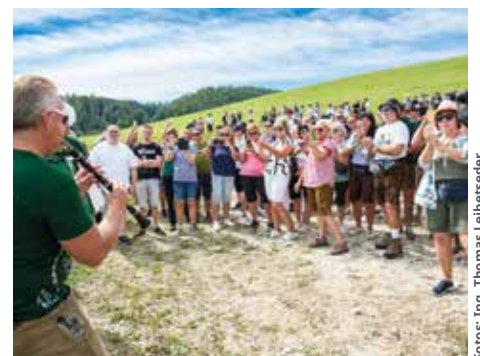
Bombenstimmung bei der ersten Labestation