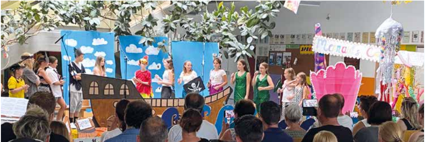
Ein Musical wurde in englischer Sprache einstudiert und in der Mittelschule Bärnbach aufgeführt

Zusätzliches Sommerferienprogramm für die Bärnbacher Jugendlichen: