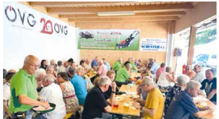
Zahlreiche Mitglieder waren der Einladung zum Siedlerversammlungsfest gefolgt und haben sich bei Speis und Trank gut unterhalten

Beim Siedlerversammlungsfest Pi-beregg-Afling-Bärnbach Ende Juli standen der Zusammenhalt und die gute Stimmung im Mittelpunkt.