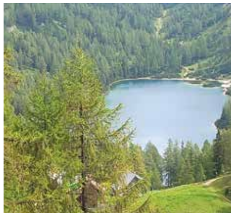
Herrlicher Blick auf den Steirersee

Die sprichwörtliche Gastfreundschaft unseres Nachbarlandes brachte alles auf den Tisch, was Küche und Keller zu bieten hatten. Die in uriger Besetzung spielende Kapelle „Drei Mann hoch“ begleitete den Aufenthalt auf dem Weinberg zünftig. Zur Überraschung aller Ausflügler hatten sie sogar den „Alten Jäger“ einstudiert. Nach dem Genuss ausgezeichnete Weine ist auch die Heimfahrt gefühlt schneller erfolgt, als die Hinfahrt.