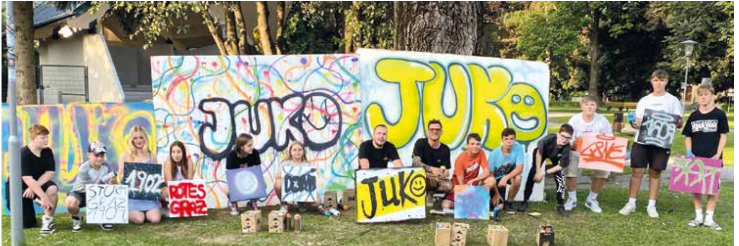
Der Graffiti Kurs für Jugendliche wurde von allen TeilnehmerInnen positiv beurteilt

Ausflüge, Escape, Imkerei, Englisch lernen und Steirerrodeln