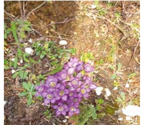
Wunderschöne Almblumen am Hochplateau