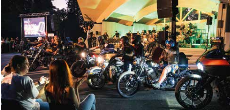
Rock & More Konzert der Bergkapelle Oberdorf

Der MRC „Harleykins“ fährt mit 13 Harleys im Stadtpark Bärnbach ein