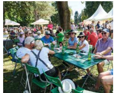
Gemütliche Pause nach der Wanderung