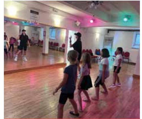
TANZSCHULE GIDER Hip Hop für Einsteiger