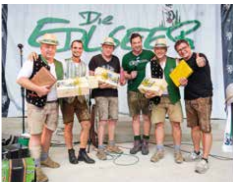
Gastgeschenke für die Musiker