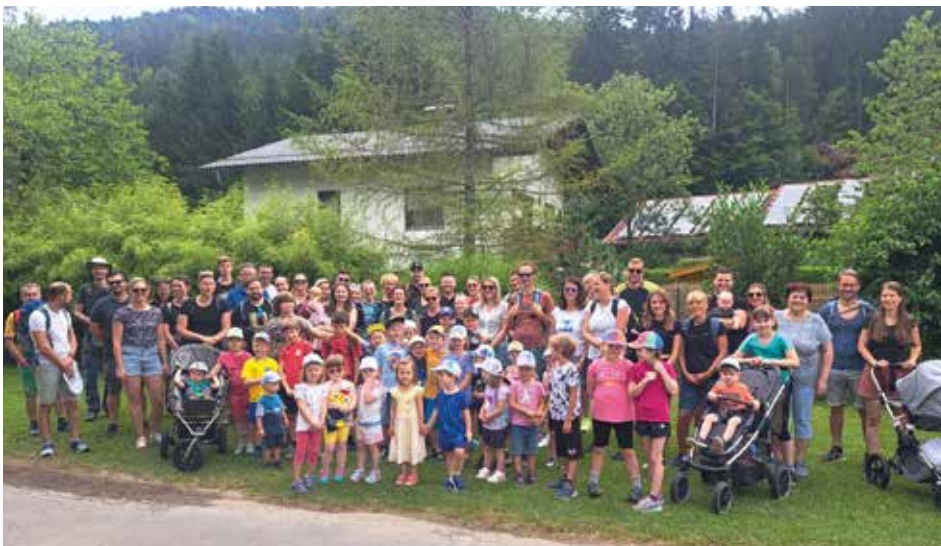
Nach einem Treffen beim Schlossbad wanderten alle entlang der Kainach

Gemeinsame Wanderung zum Spielplatz nach Piberegg