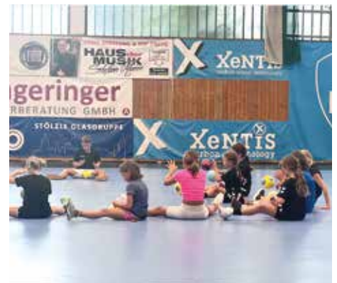
HSG XENTIS BÄRNBACH/KÖFLACH Handballspielen in der Sporthalle