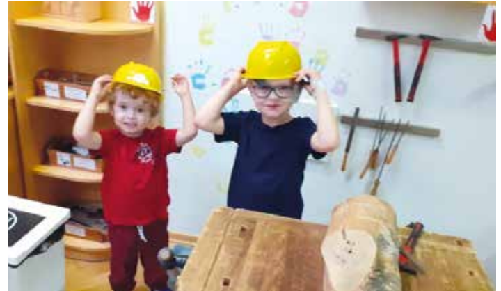
Beim Arbeiten mit Holz ist die Arbeitssicherheit sehr wichtig

Die Kinder sind bereits fleißig beim Spielen und schließen dabei neue Freundschaften.