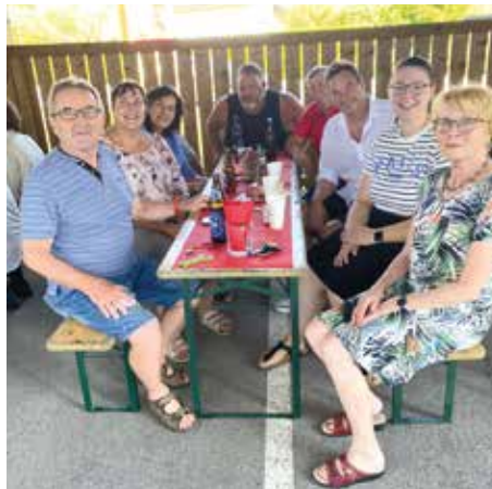
Gemeindevertreter und Anwohner feierten

Am 23. August fand die Fertigstellungsfeier in der Dr. Niederdorferstraße 12 in Bärnbach statt.