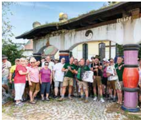
Barbarikirche: Musikalischer Zwischenstopp