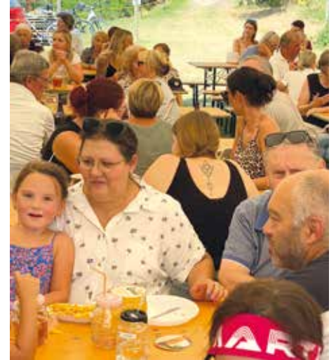
Auch für leckeres Essen war gesorgt

Das zweitägige Kinderfest war ein voller Erfolg und hat sowohl bei den kleinen als auch bei den großen BesucherInnen für leuchtende Augen und strahlende Gesichter gesorgt.