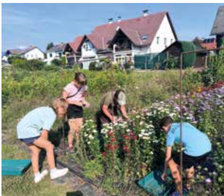
GÄRTNEREI ZWANZGER Anlegen einer Blumenwiese