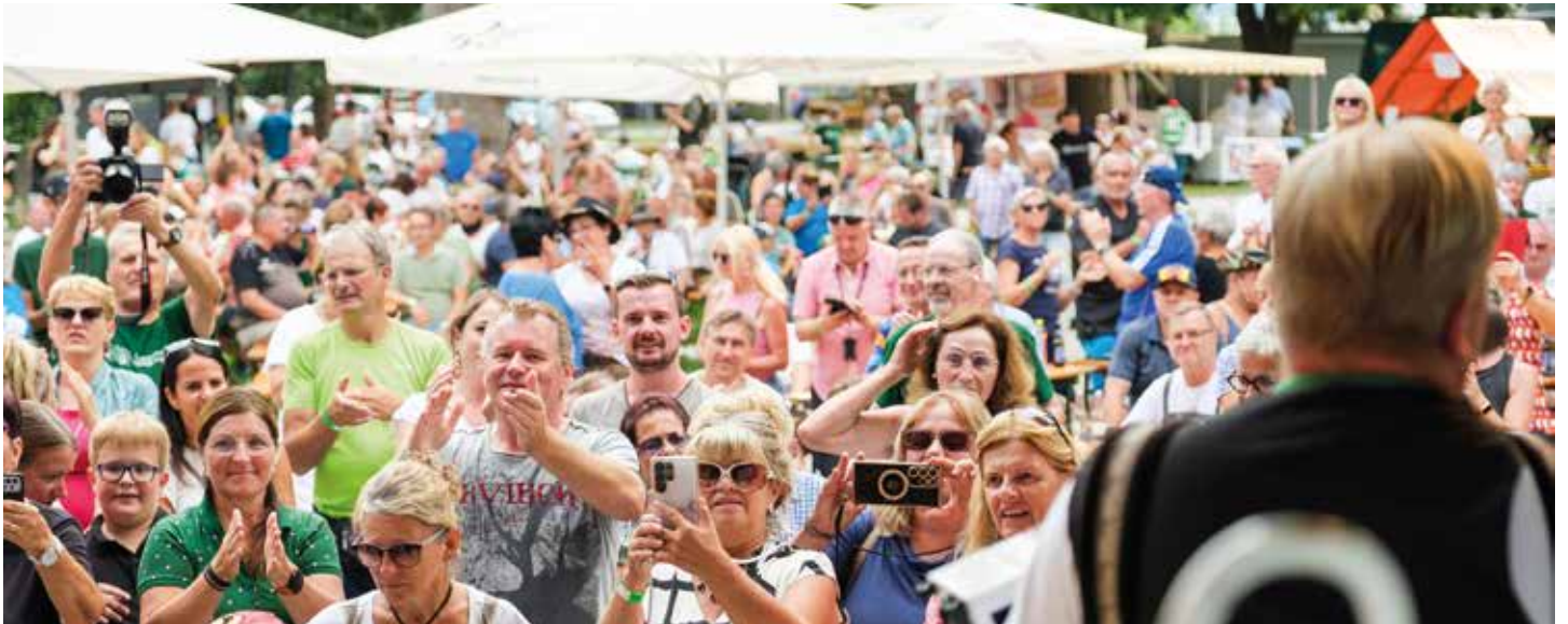
Das Konzert der Edlseer im Bärnbacher Stadtpark entfachte Begeisterungstürme im Publikum