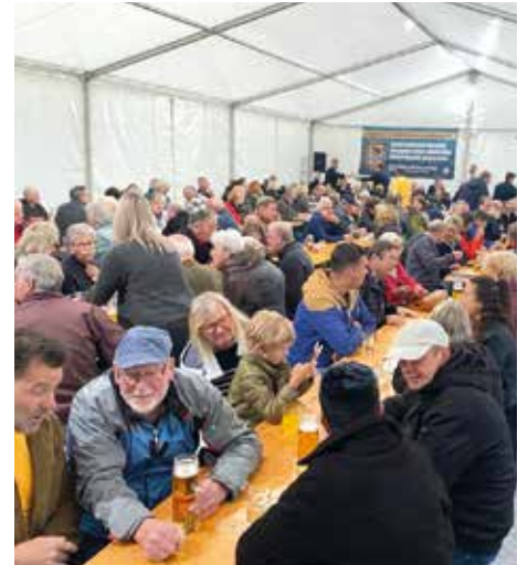
Ausgezeichnet besuchtes Festzelt

Ein großes Dankeschön gilt all jenen, die zum Erfolg des Hüttenfests 2024 beigetragen haben: dem Kulturreferat der Stadtgemeinde