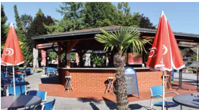
Die gemütliche Terrasse bietet pures Urlaubsfeeling

Der Gastronomiebetrieb von Sabrina Kuß im wunderschönen Schlossbad Bärnbach ist die perfekte Location für die Badegäste. Hier erwarten die BesucherInnen erfrischende Getränke, verschiedenste Speisen, eine Auswahl an köstlichen Süßigkeiten und fruchtigem Eis und natürlich die berühmten Schlossbad-Pommes.