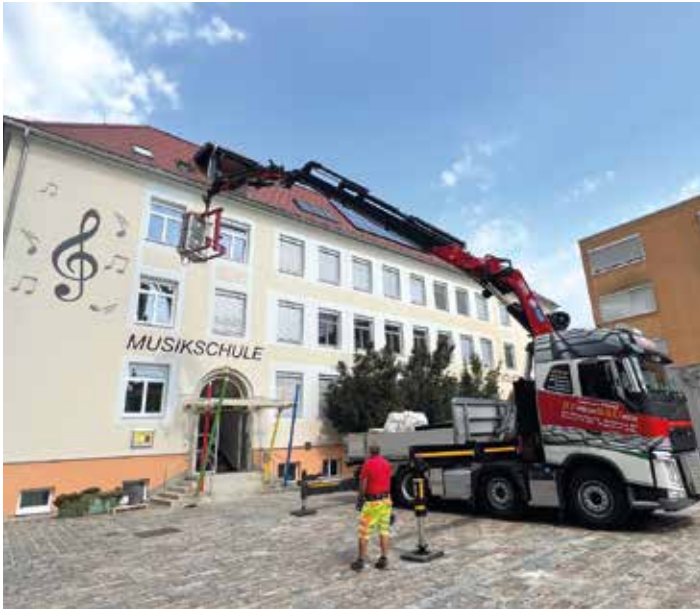
Transport der Außenanlage mittels Kran

Klimaanlage für Klasse im Dachgeschoss der VS Bärnbach