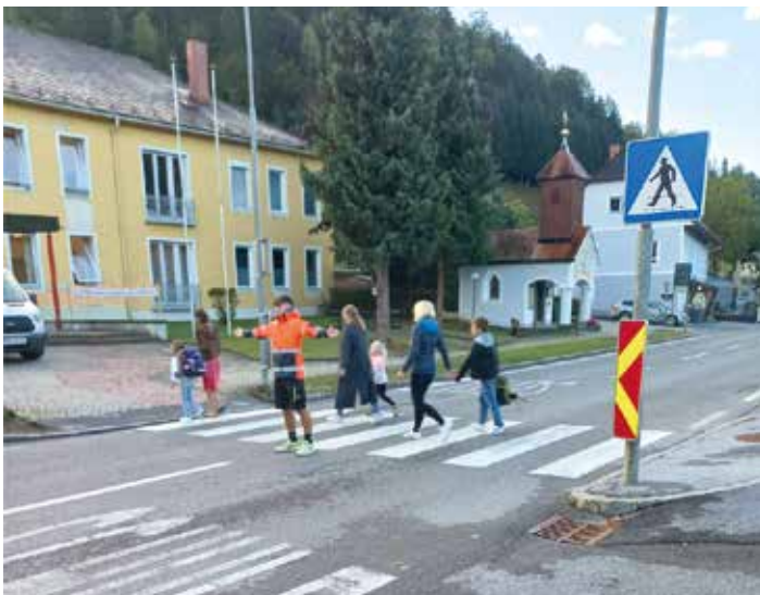
Sichere Straßenüberquerung vor der VS Afling

Ferialarbeiter im Einsatz für Sicherheit