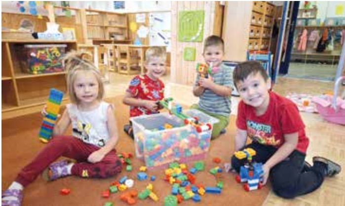
Gemeinsames Spielen fördert den Zusammenhalt

Aktiver Start in ein neues Kinderbetreuungsjahr