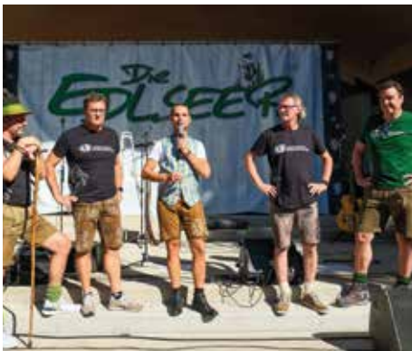
Begrüßung im Stadtpark Bärnbach