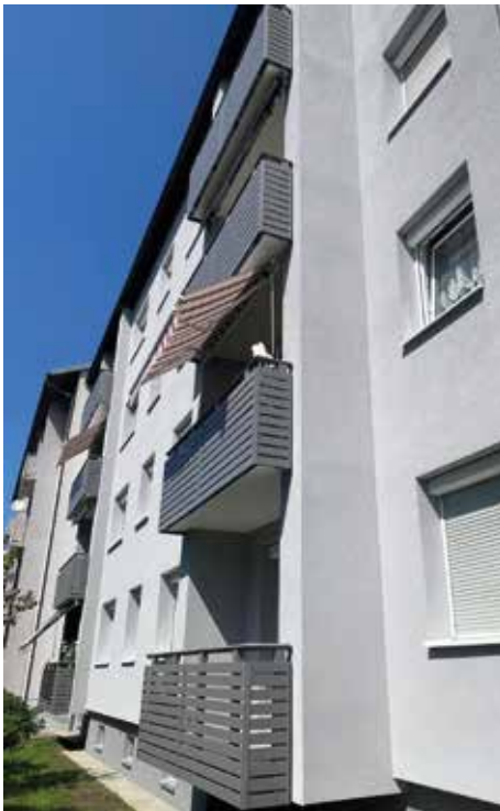
Die ansprechende neue Wohnanlage

Der Abschluss der umfangreichen Sanierungsarbeiten wurde gefeiert