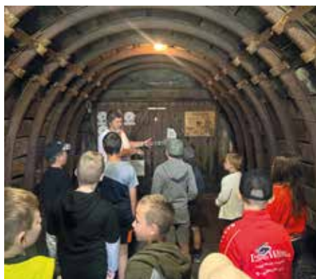
SUNFIXL HÖHLE Führung und Info über Sandsteinabbau