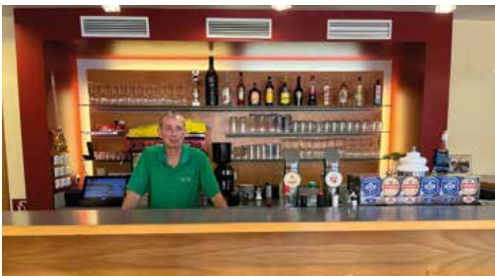
Vereine wie der Dart- und Tischtennisverein sind gerne zu Gast

Im idyllischen Ortsteil Piberegg wird man im Gasthaus „Zum Piberegg“ von Wirt Günter Bardel herzlich empfangen.