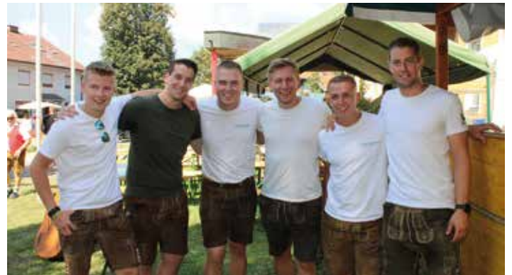
Die Gruppe Nochrucka sorgte zusammen mit Die Weingartsberger, 5e samma und Stainz 2/3 für beste Stimmung

Nach zehn Jahren Pause fand heuer endlich wieder das Aflinger Dorffest statt. Das letzte Mal wurde das Fest im Jahr 2013 veranstaltet, und es war eine Freude, diese langjährige Tradition wieder aufleben zu lassen.