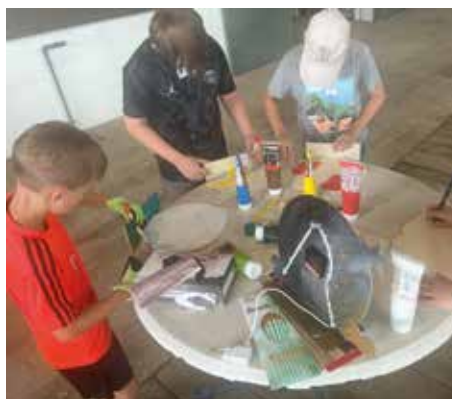
BAUHOF BÄRNBACH Anfertigen von Laubsägearbeiten