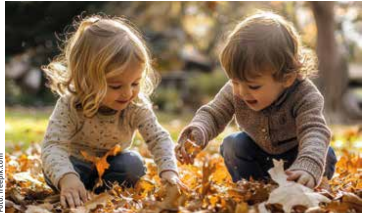
Das Spielen im Laub sensibilisiert für die Natur

Viele Eltern benötigen einen Kinderbetreuungsplatz. Eine Tagesmutter betreut Kinder in familiärer Atmosphäre, wobei der Tagesablauf flexibel und kindgerecht gestaltet wird. Zwei Tagesmütter aus Bärnbach geben einen Einblick in Ihren Alltag.