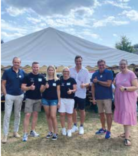
Organisationsteam und Ehrengäste

Zweitägige Veranstaltung für die ganze Familie