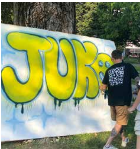
Experimentieren mit Farben und Formen

wenden. Gemeinsam mit der Englisch- und Musiklehrerin Eva Haring wurde während dieser Woche ein kleines Musical einstudiert. Perfekt, um Selbstvertrauen aufzubauen und eine Motivation, um die englische Sprache zu verwenden.