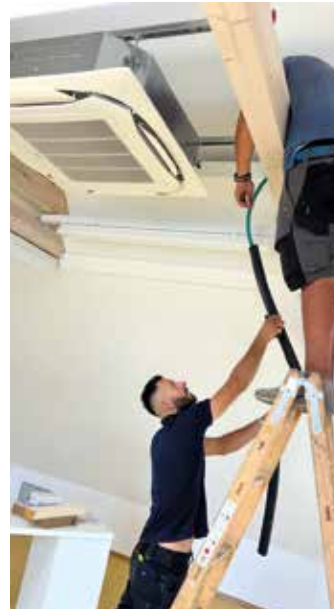
Einbau der Anlage

Pünktlich zum Schulbeginn erhielt die Volksschule Bärnbach eine Klimaanlage, die in den Räumlichkeiten im Dachgeschoss installiert wurde.