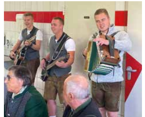
Die Nochrucka spielten auf