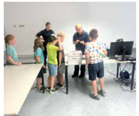
POLIZEI Infos über die Arbeit der Polizei