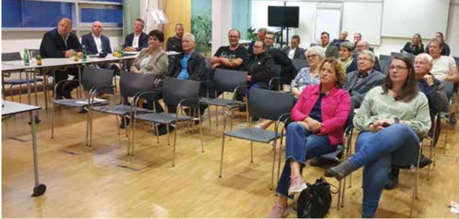
Auch Umweltlandesrätin Uschi Lackner war im Telepark zu Gast

Technologien, Sanierungsmöglichkeiten und Förderungen wurden vorgestellt