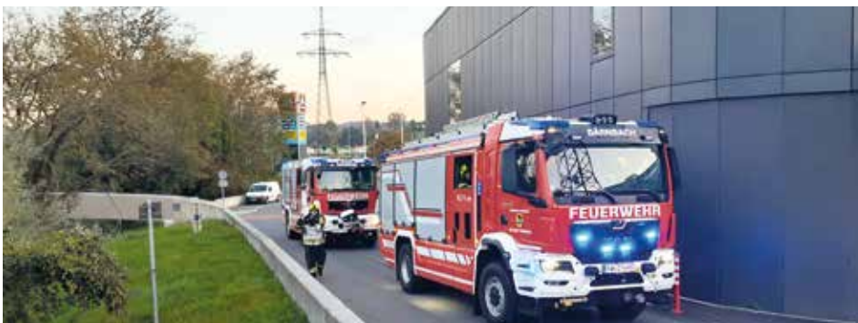
Übung der Feuerwehren Bärnbach, Rosental und Krems beim WEZ

Kürzlich wurde seitens der FF Bärnbach gemeinsam mit den Feuerwehren Rosental und Krems eine Freundschaftsübung beim Einkaufszentrum WEZ organisiert.