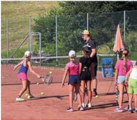
TENNISVEREIN KNOBELBERG Schnuppertraining am Sandplatz

Zahlreiche Vereine sorgten für ein attraktives Programm