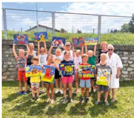
KUNSTFABRIK Kreatives Malen und Gestalten