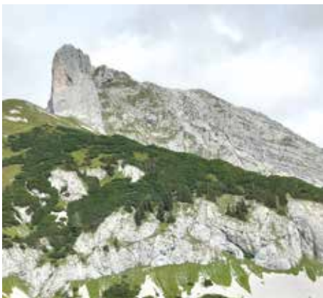
Die berühmt-berüchtigte Weisse Wand

„Da Summa is auss...“, war aber prall gefüllt mit attraktiven Angeboten, wie etwa einer Fahrt ins Blaue, die letztlich auf einem Weingut im slowenischen Jeruzalem endete. Die Besitzer des Weinguts sind gute Bekannte, kommen sie doch jedes Jahr zum Freundschaftsfest in den Bärnbacher Stadtpark.