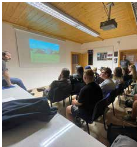
Kinoabend im JUKO

Das fertige Musical „Pirates and Mermaids“ wurde zum Abschluss des Workshops einem großen Publikum in der MS Bärnbach präsentiert.