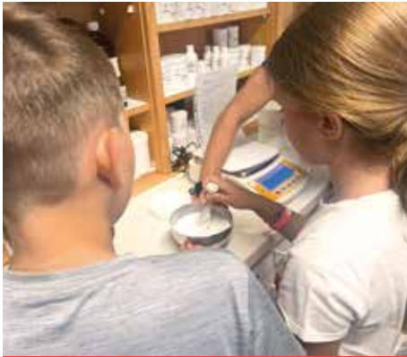
BARBARA APOTHEKE BÄRNBACH Anrühren einer Salbe

Interessante Erfahrungen wurden gemacht und Freundschaften geschlossen