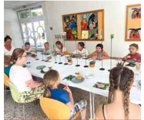
STADTBIBLIOTHEK BÄRNBACH Gemeinsames Frühstück