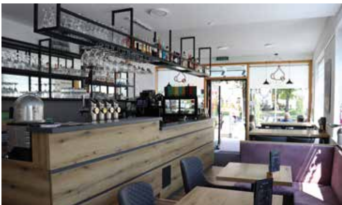
Hotspot für GenießerInnen, SportlerInnen und Kulturschaffende

Das charmante Kulturcafé ist bekannt für sein köstliches Mehlspeisenangebot, die vielfältigen Frühstücksoptionen und die abwechslungsreichen Getränkevariationen. Besonders beliebt sind die exquisiten Cocktails, die das Kulturcafé zu einem Hotspot für GenießerInnen machen.